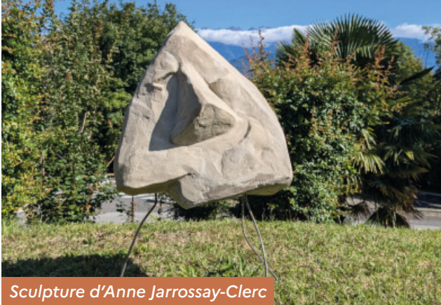
Sculpture d'Anne Jarrossay-Clerc